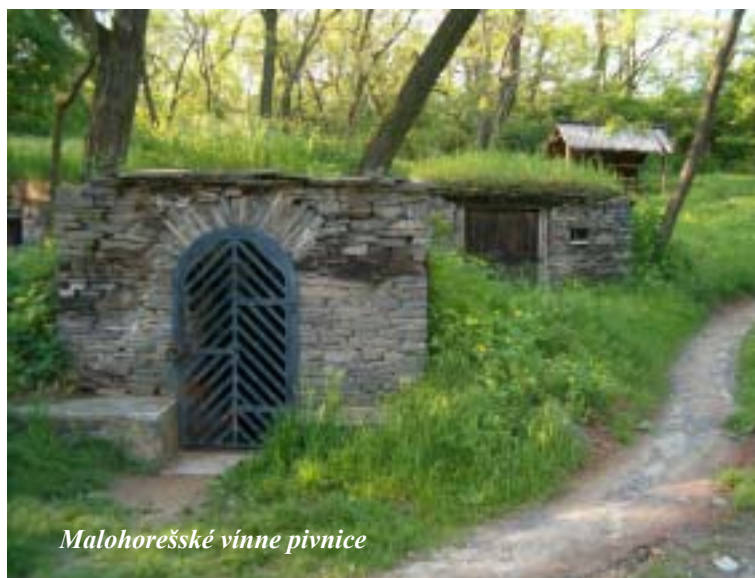
Malohorešské vínné pivnice