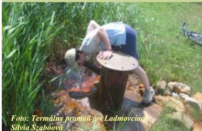
Foto: Termálny prameň pri Ladmovciach

Kultúrne centrum Medzibodrožia a Použia (Botorkáló), Horešská 40, 077 01 Kráľovský Chlmec má nové e-mailové adresy: kcmaj@dornet.sk , zkgabi@dornet.sk