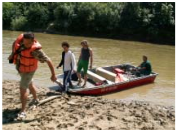
Piesočná pláž, Zemplin