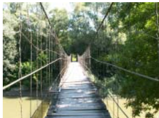
Visutý most cez Latoricu pri Boľanoch

Ďalšie stretnutie bude 6. septembra 2006 vo Viničkách v zariadení Zlatý stravec. Pozvánku dostanete.