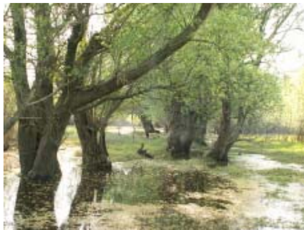
Zátišie pri Ladmovciach