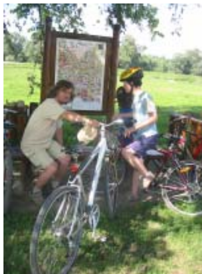
Cyklotrasa v Medzibodroží